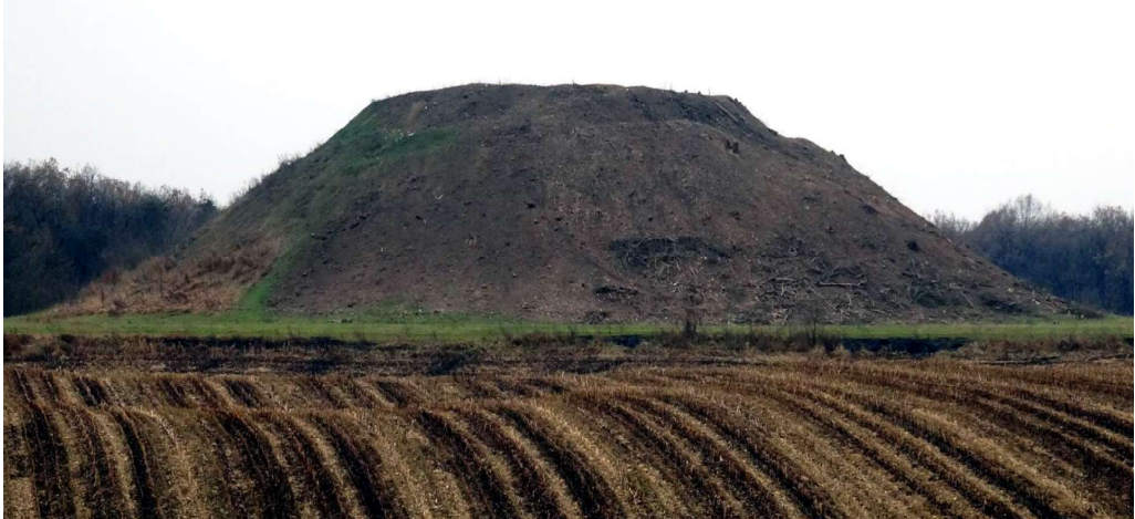
Общий вид кургана Гуацхъацэ в ноябре 2016 г.

В ноябре 2016 г. под руководством Б.Х. Бгажнокова была проведена историко-этнологическая экспедиция в результате которой было зафиксировано современное состояние крупного археологического и исторического памятника - Урванского курганного поля, включающего три больших урванских кургана: Ошхакилиса, Ошхаца и Ошхаджафа. Также об этих объектах культурного наследия народов Кабардино-Балкарии был собран исторический и фольклорный материал.