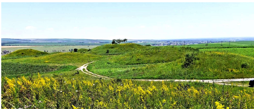
Рис. 3. Курганы могильника «Семь братьев» у селения Нижний Куркужин. Снимок автора, 2023 г.

Важно отметить, что уникальные находки камней-обелисков на территории Кабардино-Пятигорья почти не документированы и не введены в должной мере в научный оборот. Курганы Нижнекуркужинского могильника (Рис. 3) и вскрытая кладоискателями гробница, состоящая из стел VIII–VII вв. до н.э., к большому сожалению, остаются вне поля зрения археологов уже около полувека.