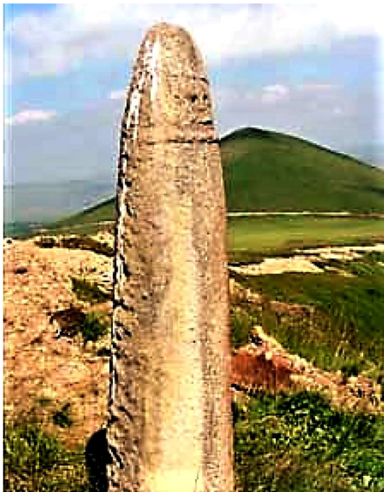
Рис. 4. Изваяние эпохи раннего железа у горы Тузлук в Приэльбрусье.

Таким образом, наличие находок конской упряжи (в том числе колесничной) и камней-обелисков предскифского времени в Кабардино-Пятигорье и Закубанье подтверждает гипотезу, высказанную Наталией Львовной Членовой.